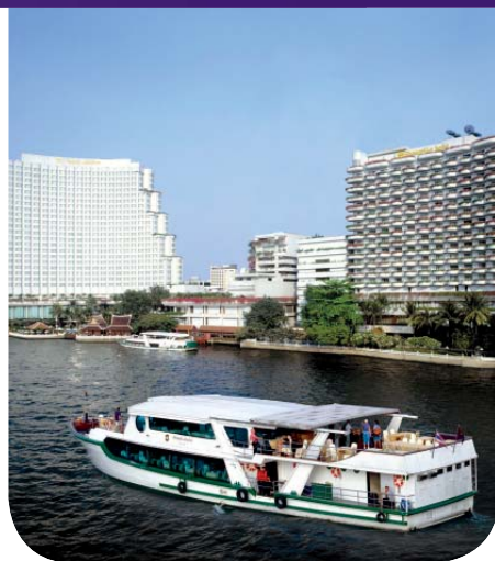
แชงกรีล่า กรุงเทพฯ

เงื่อนไข: ข้อเสนอนี้ใช้ได้กับอัตราที่กำหนด (Qualifying Rate) หรืออัตราที่สูงกว่าสำหรับการเข้าพัก ณ โรงแรมในประเทศไทย ใน คืนวันศุกร์ - วันอาทิตย์ และ ณ รีสอร์ทในต่างจังหวัดที่ร่วมรายการในคืนวันจันทร์ - วันพฤหัสบดี มีช่วงปิดรับจองสำหรับวัน หยุดนักขัตฤกษ์ และวันหยุดเทศกาลต่อเนื่อง และไม่สามารถใช้ร่วมกับรายการส่งเสริมการขายอื่นใด