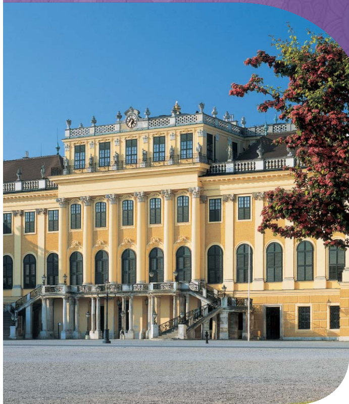
พระราชวังเชินบรุนน์ เวียนนา