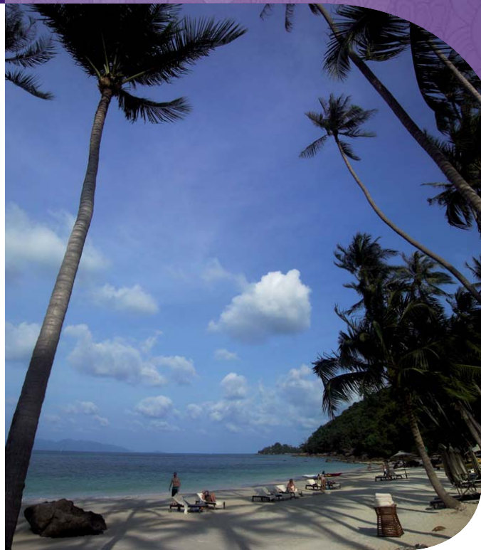
เกาะสมุย ประเทศไทย