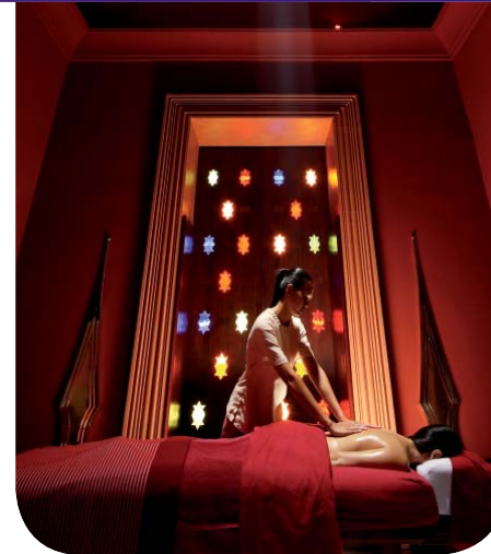
เดอะ บาราย ไฮแอท รีเจนท์ หัวหิน