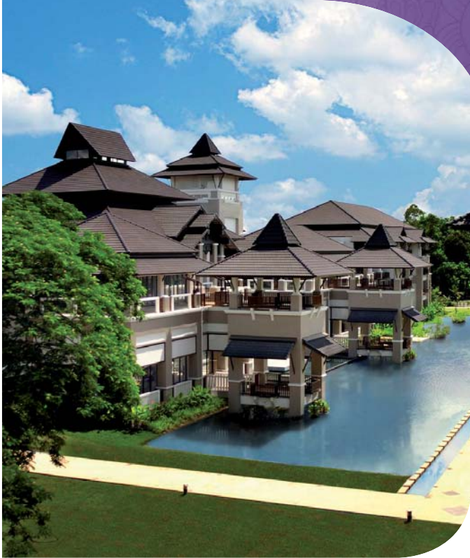
เลอ เมอริเดียน เชียงราย รีสอร์ท