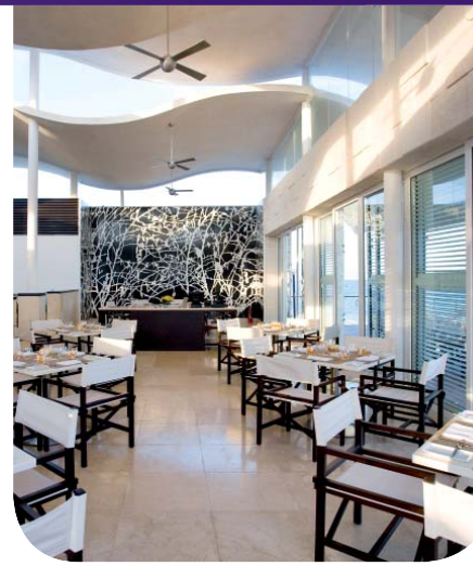
แมนดาริน โอเรียนเต็ล ริเวียร่า มายา เม็กซิโก อาความารีน่า

เงื่อนไข: ข้อเสนอใช้ได้สำหรับการเข้าพักในอัตราที่กำหนดเท่านั้น ทั้งนี้ขึ้นอยู่กับจำนวนห้องพักที่ว่าง และต้องสำรองห้องพักล่วงหน้า โปรดระบุรหัสส่งเสริมการขาย “TG0906” กรุณาแสดงบัตรสมาชิก รอยัล ออร์คิด พลัส ขณะทำการเช็คอิน สิทธิพิเศษนี้ สำหรับสมาชิก รอยัล ออร์คิด พลัส เท่านั้น และไม่สามารถใช้ร่วมกับรายการส่งเสริมการขายหรือสิทธิพิเศษอื่นๆ ได้