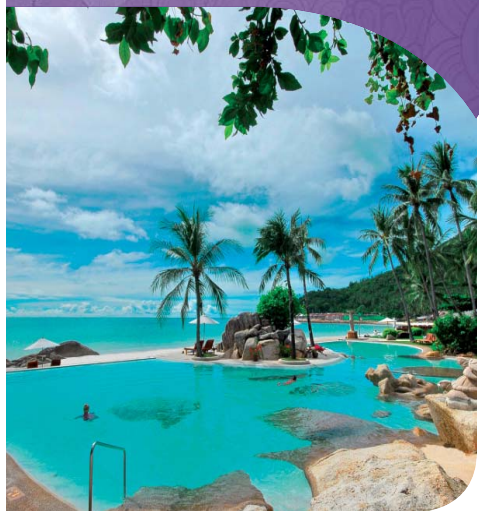
เดอะ อิมพีเรียล สมุย