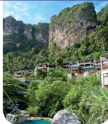
เซ็นทารา แกรนด์ บีช รีสอร์ท แอนด์ วิลล่า กระบี่