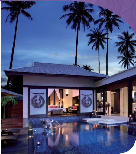
อนันตรา รีสอร์ท ภูเก็ต